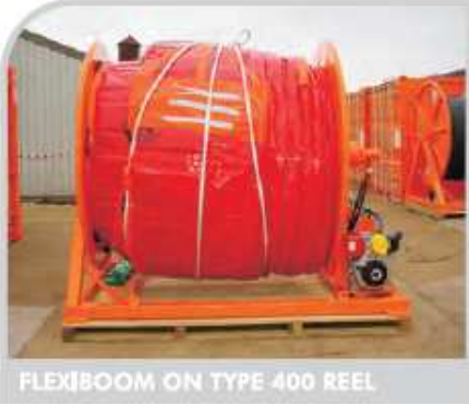
FLEXIBOOM ON TYPE 400 REEL