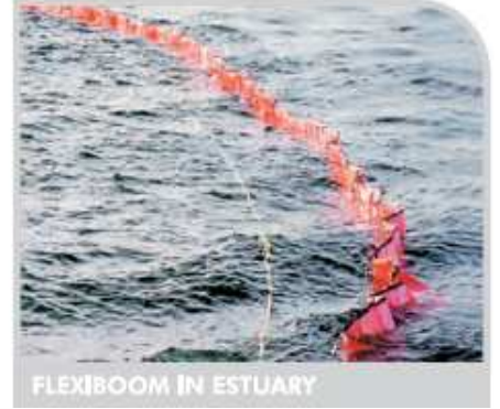
FLEXIBOOM IN ESTUARY