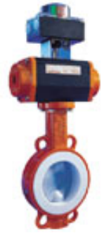
Pnömatik Aktüatörlü Kelebek Vana