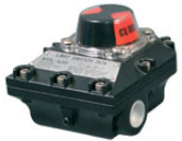
Pozisyon indikatörü ve Yardımcı Kontaklar