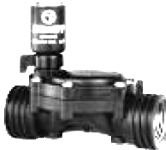
Direk Selenoid Çekmeli Diyaframlı Vana